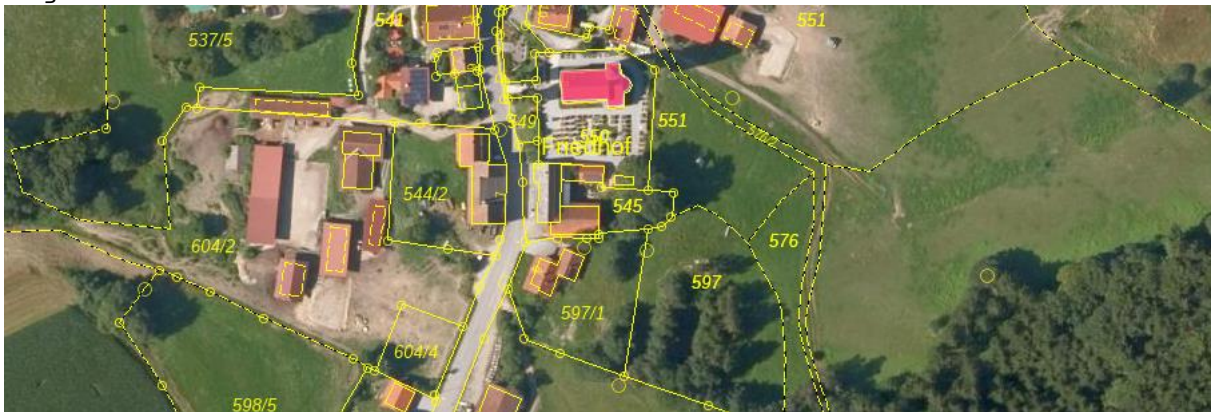
Abbildung 2: Ausschnitt Denkmalviewer Bayern

Erweiterungsfläche nicht gegeben. Beeinträchtigungen auf das Baudenkmal durch die Pferdestallungen und offenen Viehunterstände sind nicht zu erkennen.