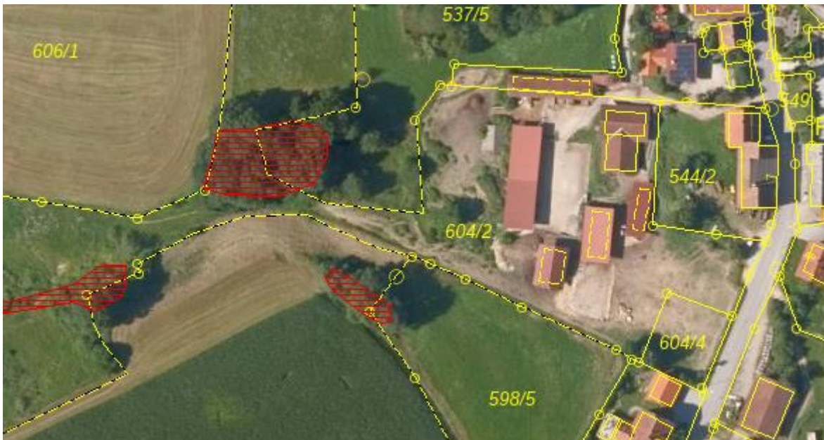
Abbildung 3: Ausschnitt Bayern-Atlas, Biotopkartierung

Westlich und südlich des Ergänzungsbereiches befinden sich biotopkartierte Flächen. Eine Beeinträchtigung dieser Flächen durch die Erweiterung des bestehenden Geltungsbereiches der Klarstellungs- und Ergänzungssatzung Riggerding sind nicht zu befürchten